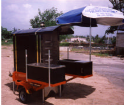
Modelo tipo 4 Trecito

*Don't forget to ask for your free umbrella.