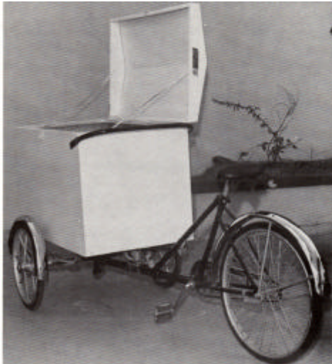
Bicicleta Triciclo Modelo T.D

BOX 7308 BO. OBRERO STATION SAN JUAN P.R 00916-7308