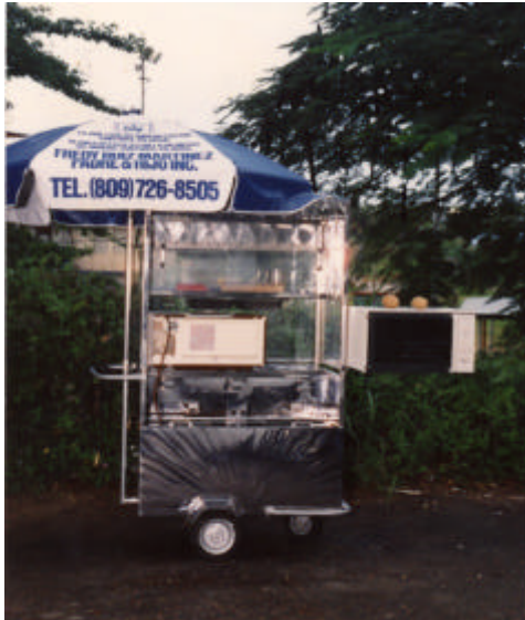
Modelo "Lo último de la avenida"

"Hágase de su propio negocio porque esto deja fijese que el de Maneco en Wilson Wilson empezó con un carrito de hot dogs y ahora tiene un restaurant".