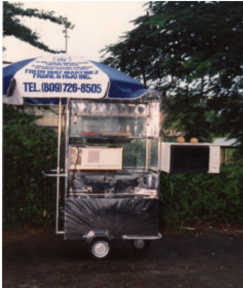
Modelo "CD "