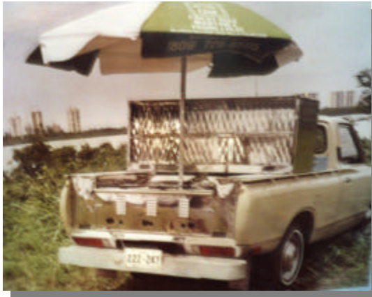
Modelo "Pick up Jr"

*Don't forget to ask for your free umbrella.